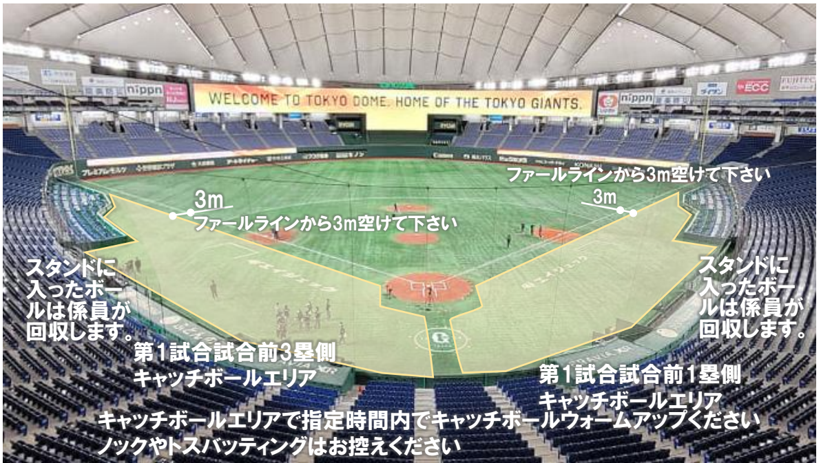
第1試合試合前キャッチボールエリア