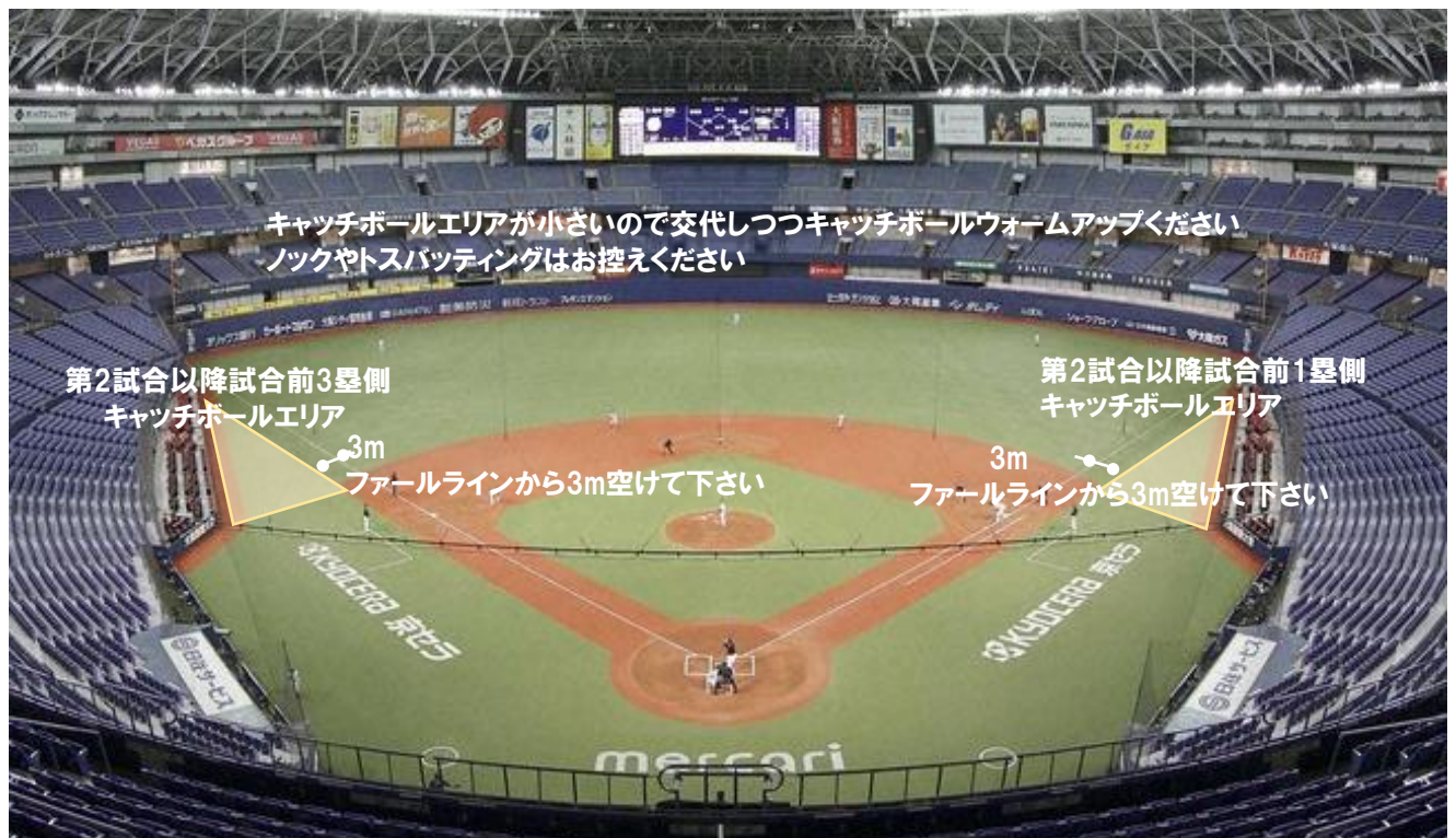
第2試合以降試合前キャッチボールエリア