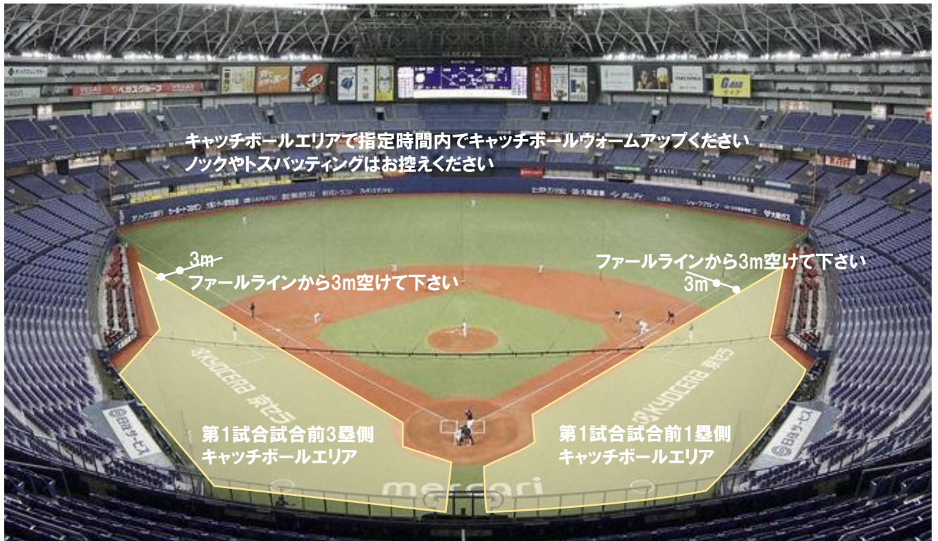
第1試合試合前キャッチボールエリア