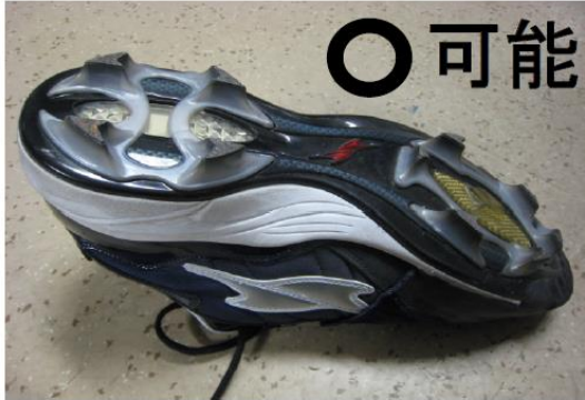
◎ポイントスパイク(合成樹脂・ゴム製) ◎スニーカー