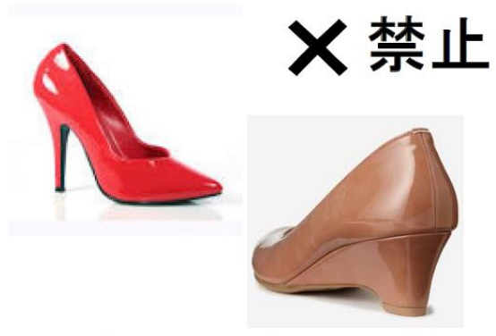
×ハイヒール・ウエッジヒール