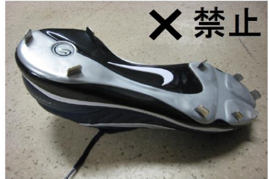
×金属製・プラスチック製・セラミック製