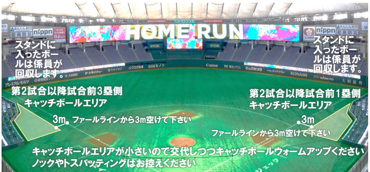
第2試合以降試合前キャッチボールエリア