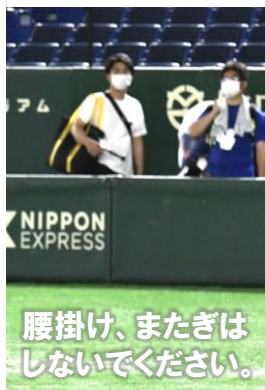
カメラマン席のフェンス